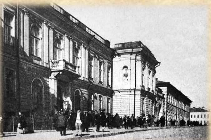
Харківський університет (фото поч. ХХ ст.)

По закінченні університету деякий час служив юнкером в уланському полку, потім викладав історію в гімназіях Харкова, Рівного, Києва, зокрема 1845 р. – старший учитель Першої київської гімназії, з 1846 р. – ад'юнкт-професор кафедри російської історії Київського