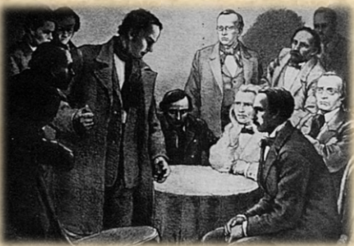
Члени Кирило-Мифодіївського товариства

У 1845–46 рр. разом з М. Гулаком і В.Білозерським заснував Кирило-Мефодіївське братство, де брав активну участь у складанні програмних документів – «Книг буття українського народу», «Статуту Слов'янського товариства св. Кирила і Мефодія», відозв «До братів-українців», «До братів-росіян», «До братів-поляків»; автор записки про об'єднання слов'янських народів.